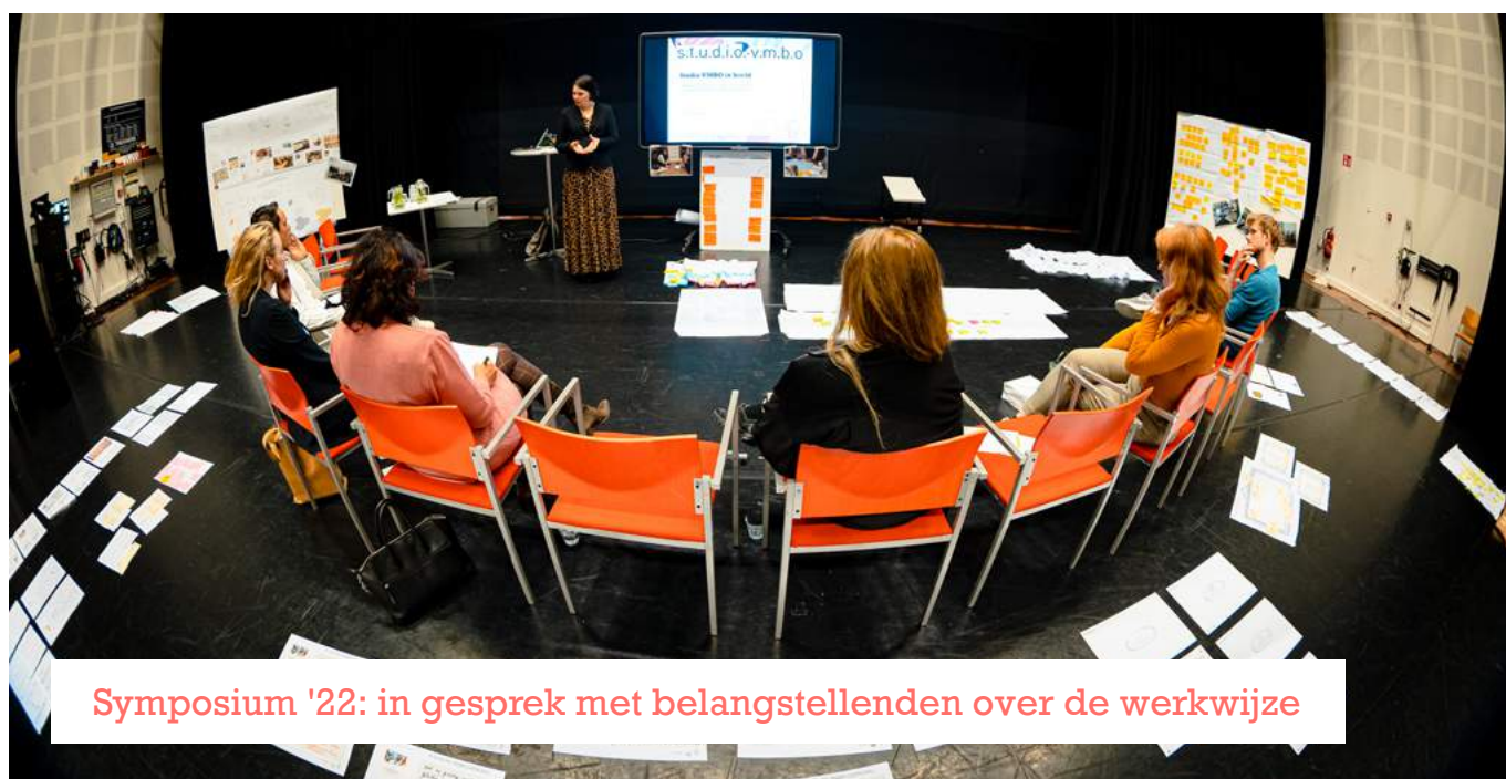
Symposium '22: in gesprek met belangstellenden over de werkwijze

Drie jaar meedoen in Studio VMBO heeft niet alleen impact gehad op de leerlingen, maar ook op de betrokken docenten van Pro Almere. Het heeft hen een bredere en andere kijk gegeven op de leerlingen. Ook heeft de deelname bijgedragen aan een gevoel van trots