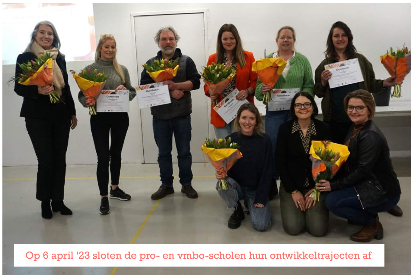
Op 6 april '23 sloten de pro- en vmbo-scholen hun ontwikkeltrajecten af